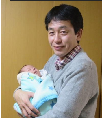
双子の姪っ子が誕生！