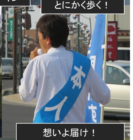
想いよ届け！ 駅前交差点にて訴える