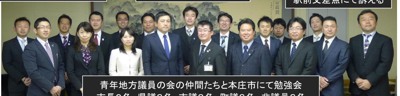
青年地方議員の会の仲間たちと本庄市にて勉強会 市長2名 県議3名 市議8名 町議3名 非議員3名