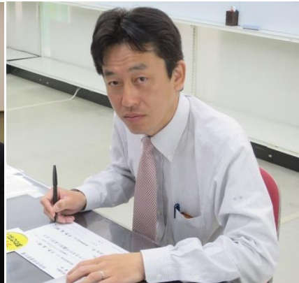
子供にツケをまわさない！ 納税者保護誓約書にサイン