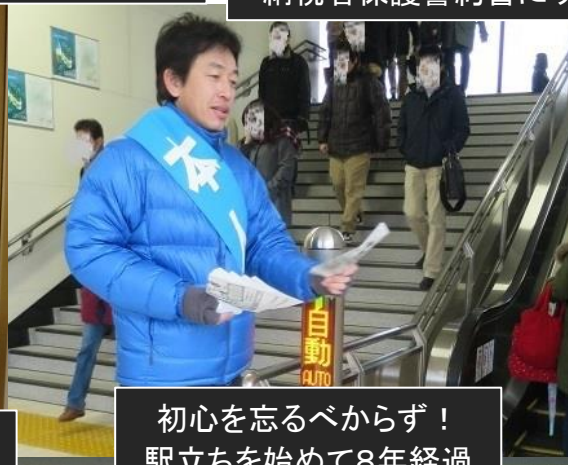
初心を忘るべからず！ 駅立ちを始めて8年経過