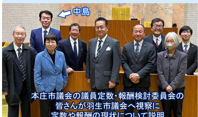
本庄市議会の議員定数・報酬検討委員会の 皆さんが羽生市議会へ視察に 定数や報酬の現状について説明