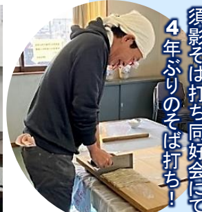
須影そば打ち同好会にて 4年ぶりのそば打ち!

社会が変わった。 暮らしが変わった。 しかし、市議会と多くの議員は 旧態依然のまま 子ども達の未来のため、 高齢者の安心のため、 私は変えたい。 変えなければならない。 誰かに任せられない。 だからやる。 私がやる。 あきらめない。 挑み続ける!