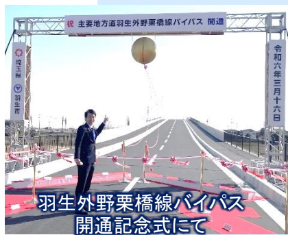
羽生外野栗橋線バイパス 開通記念式にて