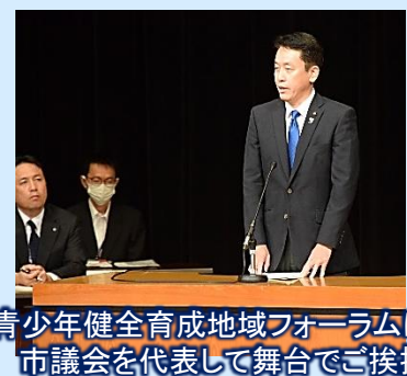
青少年健全育成地域フォーラムにて 市議会を代表して舞台でご挨拶