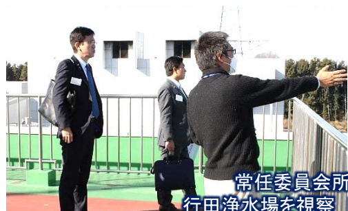
常任委員会所管事務調査 行田浄水場を視察 県水の現状を確認