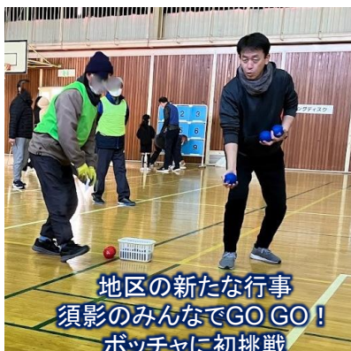
地区の新たな行事 須影のみなでGO GO! ポッチャに初挑戦