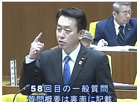
58回目の一般質問 質問概要は裏面に記載