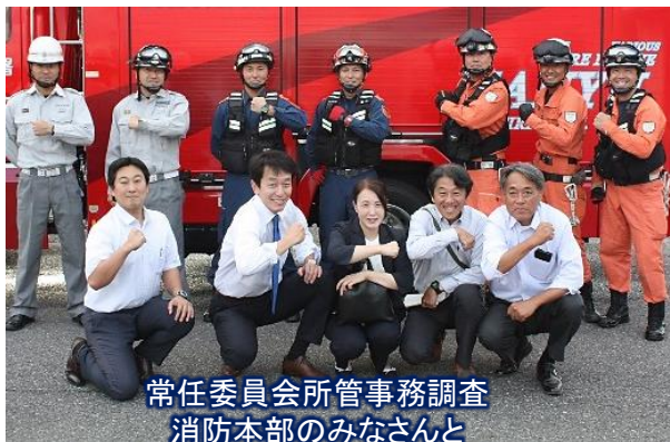
常任委員会所管事務調査 消防本部のみなさんと