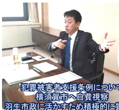
犯罪被害者支援条例について 横須賀市へ自費視察 羽生市政に活かすため積極的に質疑!