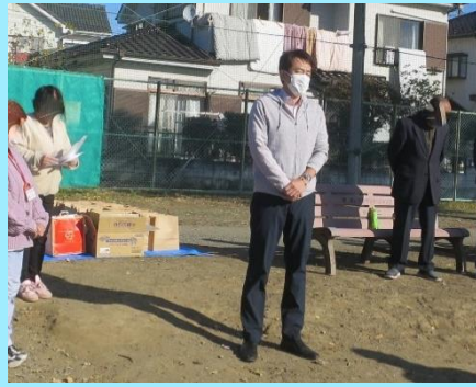
地区愛育班のグランドゴルフ大会 今年度になって初めて地域の行事にお招きをいただきました。ご挨拶をさせていただいた後に皆さんとともにワンプレー!