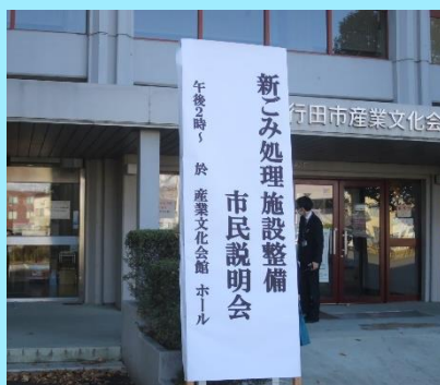
行田市の市民説明会を拝聴 行田市長から羽生へ広域化の呼びかけが! 羽生市からは担当部課長他2名が。羽生市議会からは5名の姿が会場にあり。