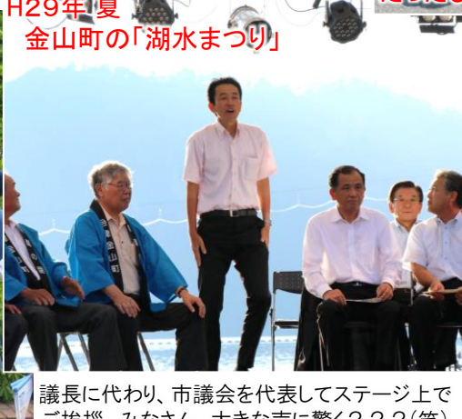
H29年夏 金山町の「湖水まつり」