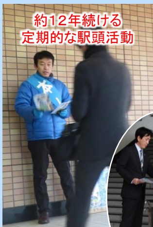
約12年続ける定期的な駅頭活動