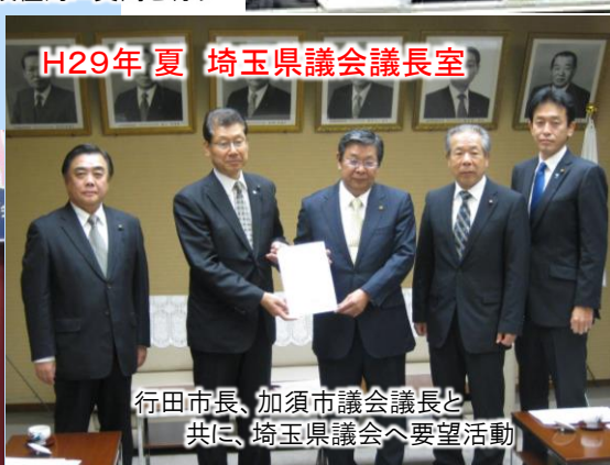
H29年夏 埼玉県議会議長室