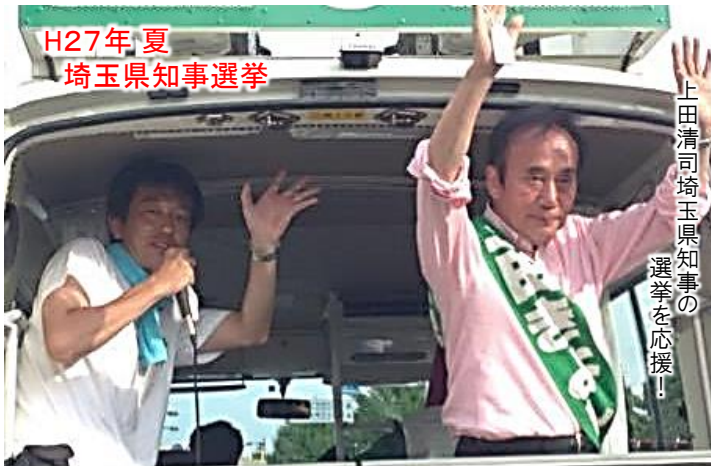
H27年夏 埼玉県知事選挙