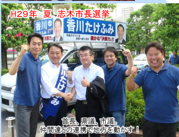
H29年夏 志木市長選挙